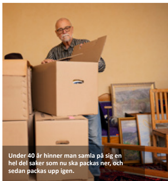
Under 40 år hinner man samla på sig en hel del saker som nu ska packas ner, och sedan packas upp igen.