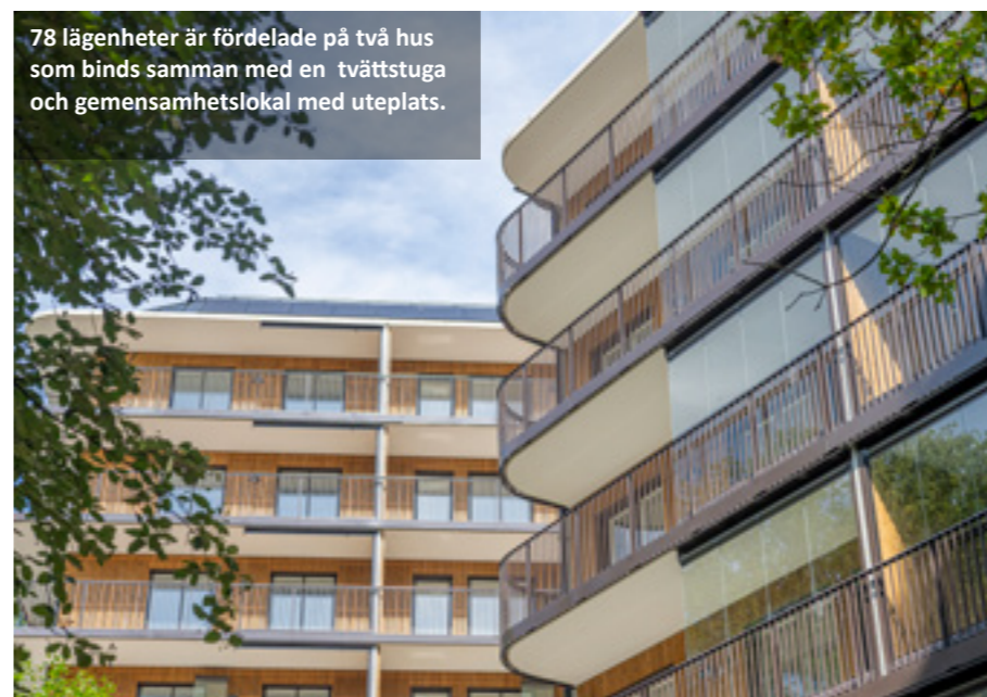
78 lägenheter är fördelade på två hus som binds samman med en tvättstuga och gemensamhetslokal med uteplats.